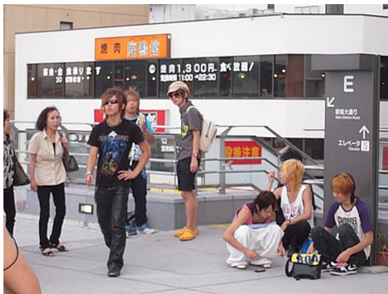
メッセージを聴いていたヤンキーたちにメッセージの感想を求めると、「なくはないですね(ヤンキーA)」。